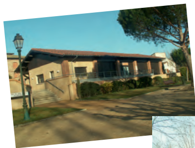
< Pôle des aînés.

Rappelons-nous ce qui a été fait avec cet argent :