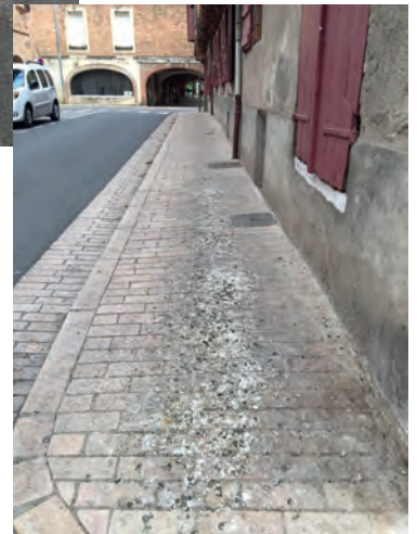
Une propreté en centre bourg qui laisse à désirer.