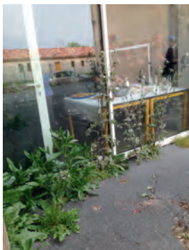
A l'école Lapeyrière : hautes herbes dans le goudron de la cour.