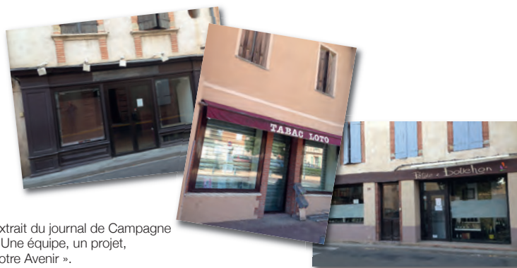
Extrait du journal de Campagne « Une équipe, un projet, notre Avenir ».

Heureusement certaines initiatives fonctionnent, notamment l'association des 18 artisans regroupés dans la maison Lafage (« Espolitaquo ! »). Nous souhaitons aussi pleine et entière réussite aux repreneurs du magasin d'optique, du SPAR ou du tabac de la place Paul Saissac et espérons que les initiatives privées se multiplieront. Il en va de l'avenir de notre commune.