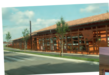
Collège, crèche, Bâtiments sportifs (tennis / dojo).