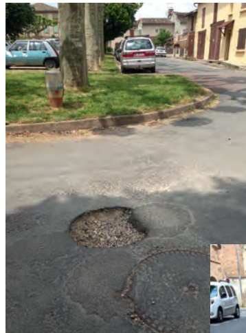
Place Turle : trou toujours présent fin Mai 2015.