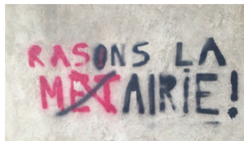
TAGs antirépublicains qui restent en place sur les murs.